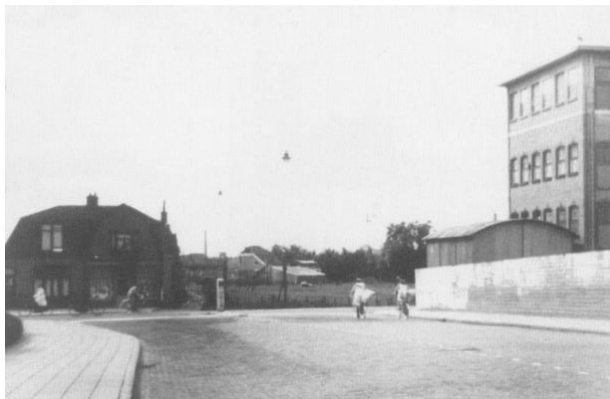
Afrit Prins Bernhardbrug ca. 1950

Na het gereedkomen van de Bernhardbrug kon het verkeer alleen maar links- of rechtsaf de Westzijde in. Pas 16 jaar later waren de plannen gereed om het verkeer door te kunnen laten rijden tot de Provincialeweg. Hiertoe werden de weilanden vanaf de Westzijde tot aan de Vaart met zand opgespoten en werd een begin gemaakt met het slopen van de 17 e eeuwse huizen van Klein Rome, Meester Cornelispad en Blauwepad. De Vaart werd afgesloten en ter plaats van de weg gedempt.