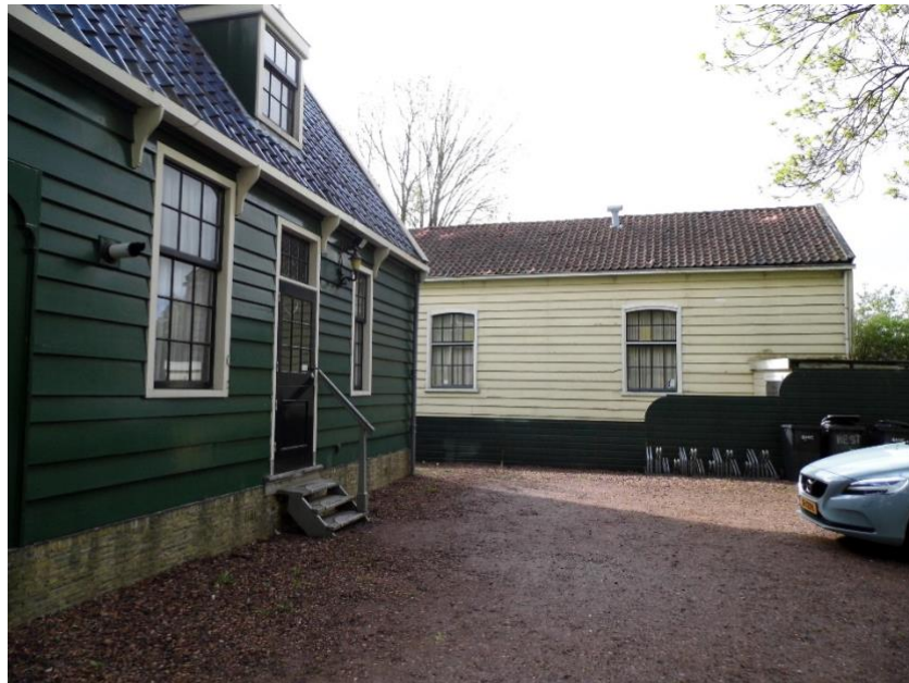
Links zijkant Geboortecentrum, rechts de Vermaning

Achter Westzijde 181 staat nog een opmerkelijk gemeentelijk monument. Het is een oude Doopsgezinde Vermaning uit Wormer. Dit houten gebouw stamt uit ca. 1650 en is in 1851 overgeplaatst naar Zaandam. Tot 1972 had het een functie als kerkgebouw, daarna heeft het o.a. gefunctioneerd als clubgebouw van zwem- en polovereniging Nereus. Sinds 2001 repeteert hier het Noord-Hollands Byzantijns Mannenkoor. Er zijn plannen om deze Vermaning te verplaatsen naar de Zaanse Schans.